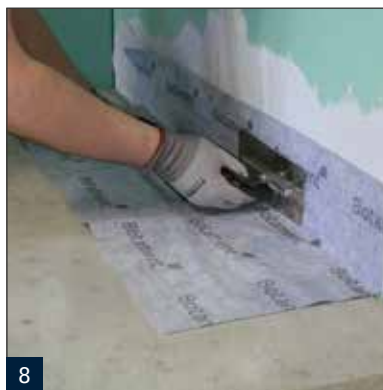
8 Einarbeiten der werksseitig angebrachten Dichtmanschette mit Multiproof.