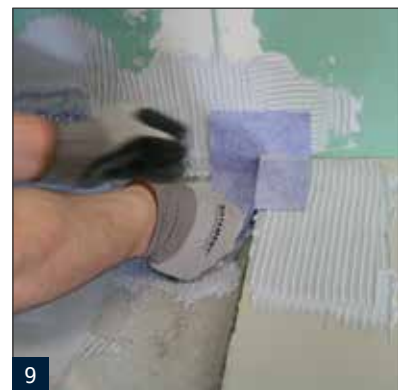
9 Einarbeiten der SB78 Stufenmanschette im Eckbereich der Dusche.