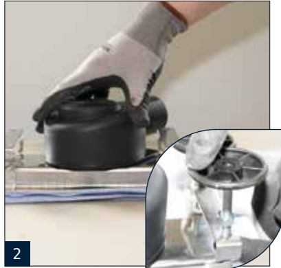
2 Montage der optionalen variable einstellbaren Montagefüße. Bitte alle Verbindung mit entsprechenden Gleitmittel versehen.