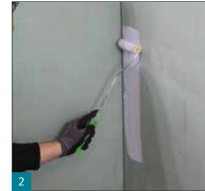
2 Bei den Wassereinwirkungsklassen WO-I – W2-I (Wand) wird MULTIPROOF® in zwei Lagen mit einer Gesamttrockenschichtdicke von mindestens 0,5 mm aufgetragen.