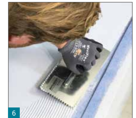
6 Bei den Wassereinwirkungsklassen W2-I und W3-I sowie auf Balkonen und Terrassen wird MULTIPROOF® in einer Mindesttrockenschichtdicke von 2,0 mm aufgetragen.