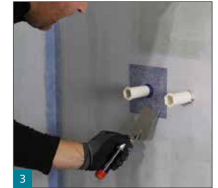
3 Das Systemdichtband SB 78 und die Dehnzonenmanschetten SB 100 werden in die erste Lage der Abdichtung eingearbeitet.