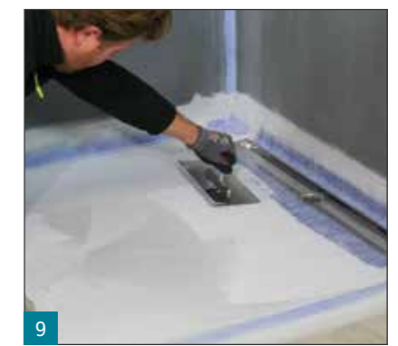
9 Nach vollständiger Durchtrochnung der ersten Lage wird die zweite Lage aufgebracht. Optische Durchtrochnungskontrolle: Farbtonwechsel von hell- zu dunkelgrau