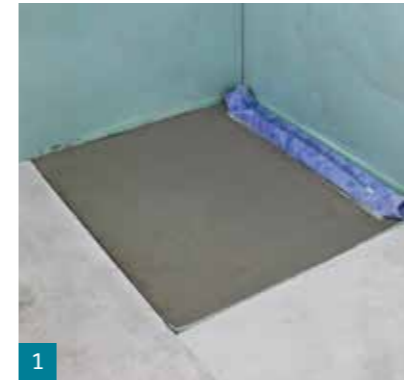
1 Saugende Untergründe können zur Staubbindung vorab mit D 11- oder D 1 Speed grundiert werden. Mineralische Untergründe müssen mattfleucht sein bzw. vorgesässt werden.