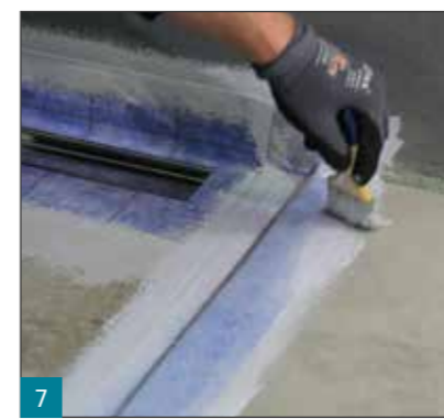
7 Die werksseitig angebrachte Manschette der Linienentwässerung, das Systemdichtband SB 78 und die Zubehörteile werden in die erste Lage der Abdichtung eingearbeitet.