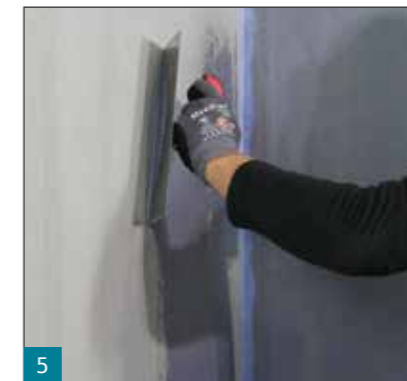
5 MULTIPROOF® kann wahlweise gerollt, gespachtelt, gestrichen oder maschinell gespritzt werden. Auf porigen und lunkerreichen Untergründen vorab eine Kratzspachtelung mit MULTIPROOF® aufbringen und trocknen lassen.